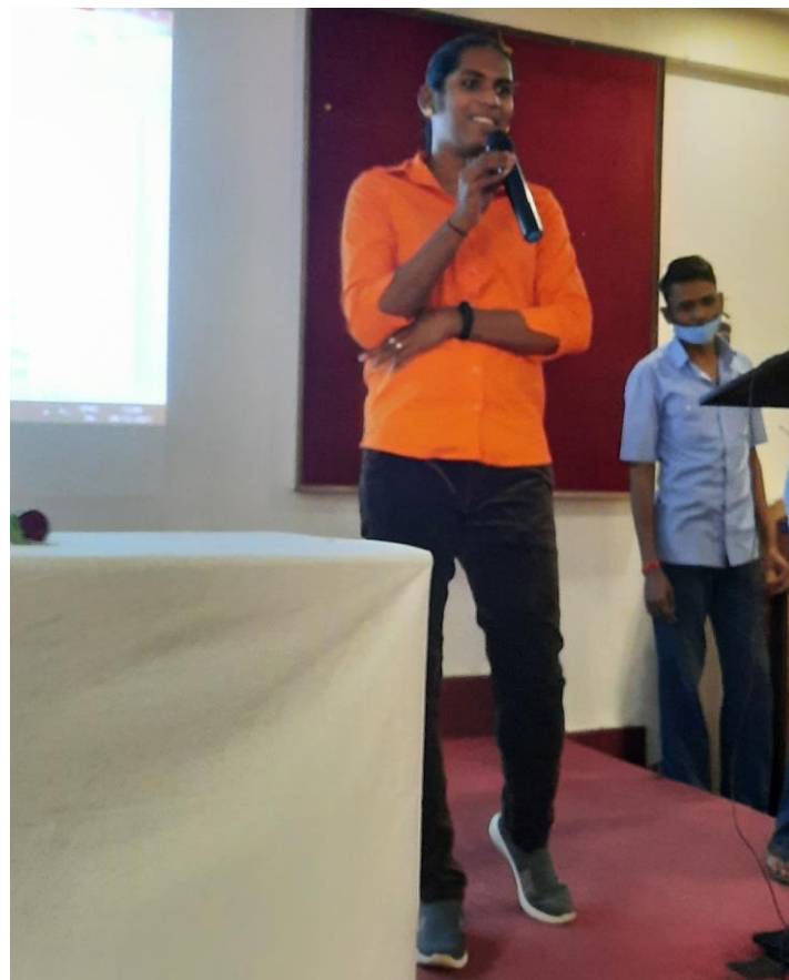
Interaction with the Students and Faculty Members